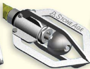
Super Centralizer WH 085 - 5.6" diameter WG 085 - 6.9" diameter