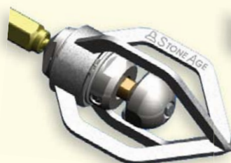
Super Centralizer WS 084 - 4.5" diameter