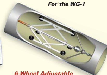
6-Wheel Adjustable Centralizer WG 286-M-P16 For 13" to 40" diameters.