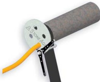
BJ 310 para tubos 4" 8"

Cliente responsable de asegurar para pipe. Trata O.D. de manguera de 3/8 pulgada a 9/16 pulgada.