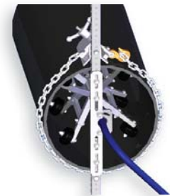
BJ 325 para 15" para tubos 36"

Maneja el(la/los/las) de O.D. de manguera de 9/16 pulgada a 7/16 pulgada