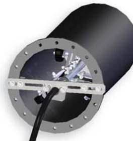
BJ 320 para 5inch para tubos 17"

Incluye abrazadera para asegurar pipe. O.D. de herramienta de asas es de 1 diámetros de pulgada de 1/2 o más grande.