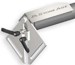
BJ 305 para 2" para tubos 6"

Estos dispositivos son diseñados específicamente para operador safety. Ayudan impedir la boquilla de se echar atrás en el tubo. Algunas opciones están disponibles para las plantillas de guía para tubos de diamer pequeños, para tubos con diámetros de círculo de perno de pestaña varios, y adaptadores para tubos sin anotación de pestaña.