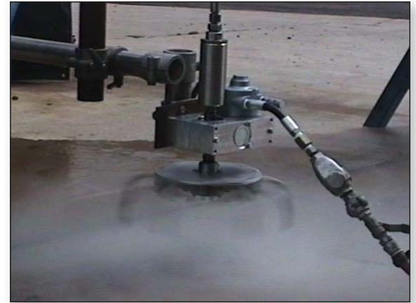
Psi de 40k con configuraciones de reactor de radio barra encabezar