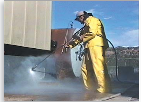
Preparativos de superficie seguros y eficaces

El nuevo sistema reduce el tiempo improductivo y mejora la accesibilidad a artículos de ropa. Ahora los operadores pueden tener un cartucho a mano que puede ser instalados en minutos. El cartucho viejo puede ser campo atendido y listo para la re- instalación cuándo necesitar.