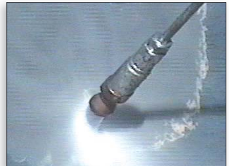
Los modelos de 40k se centran en un precinto de cartucho reemplazable